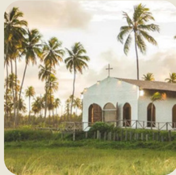
São Miguel dos Milagres