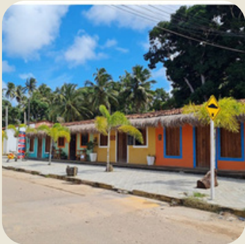
Passo de Camaragibe

Para nós a região se destaca por sua capacidade de desenvolvimento sustentável valorizando a preservação ambiental e o turismo responsável, que por sua vez, recebe visitas do mundo todo em busca do contato com a natureza