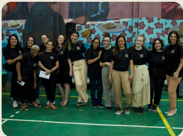
EQUIPE SÃO PAULO