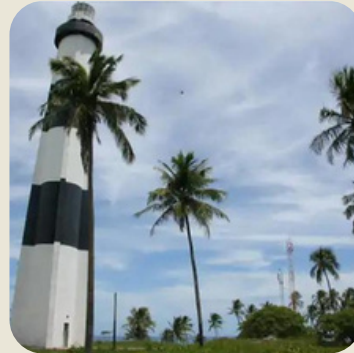
Porto de pedras